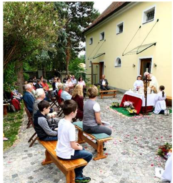
Wegen des Corona-Virus fand das Fronleichnamfest heuer im Pfarrgarten statt. Die Prozession musste entfallen.