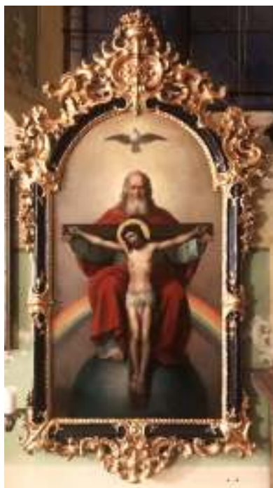
Ein Gott in drei Personen: Gott Vater, Gott Sohn und Gott Heiliger Geist.

Ich wünsche Ihnen/Euch eine gute Erholung in den Sommerferien und einen schönen Urlaub. Bleiben Sie gesund und kommen Sie gut mit neuer Kraft und Zuversicht nach Hause! Dazu Gottes Segen!