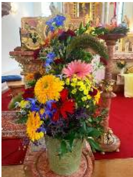
Blumenschmuck in Regenbogenfarben