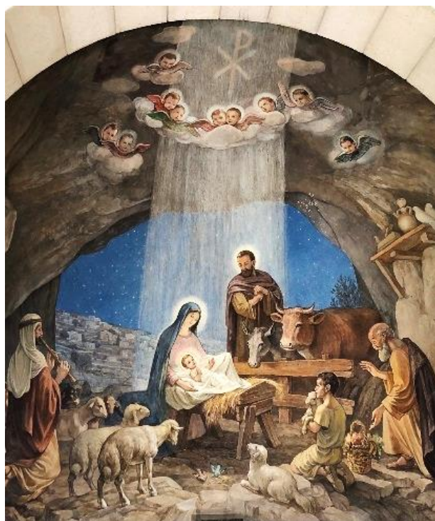
Jesus in Familiengemeinschaft Hirtenkirche bei Bethlehem

Jesus ist immer im Zentrum. Ich wünsche allen, dass Jesus, der in die Welt