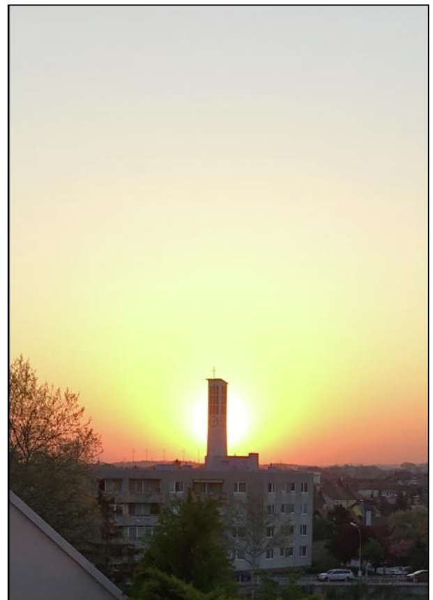
Aufgenommen heuer am Ostersonntag von der Franz-Binder-Straße aus