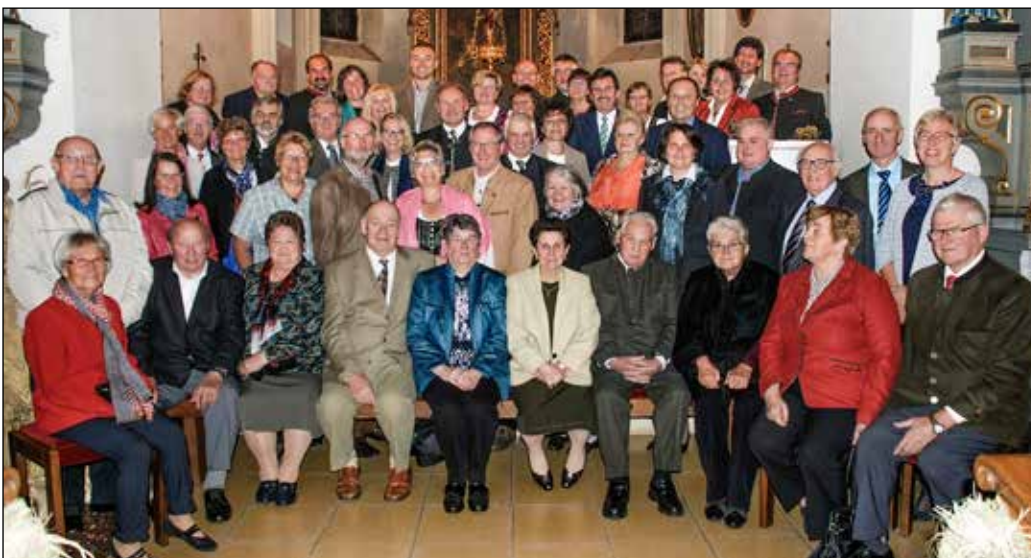
Die Jubelpaarmesse wurde in Hafnerbach am 24. September unter dem Motto „Getragen von der Flamme der Liebe“ gefeiert. (Namen siehe linke Seite).

Anmeldung bei Janette Gruber Tel. 0680 / 217 60 27