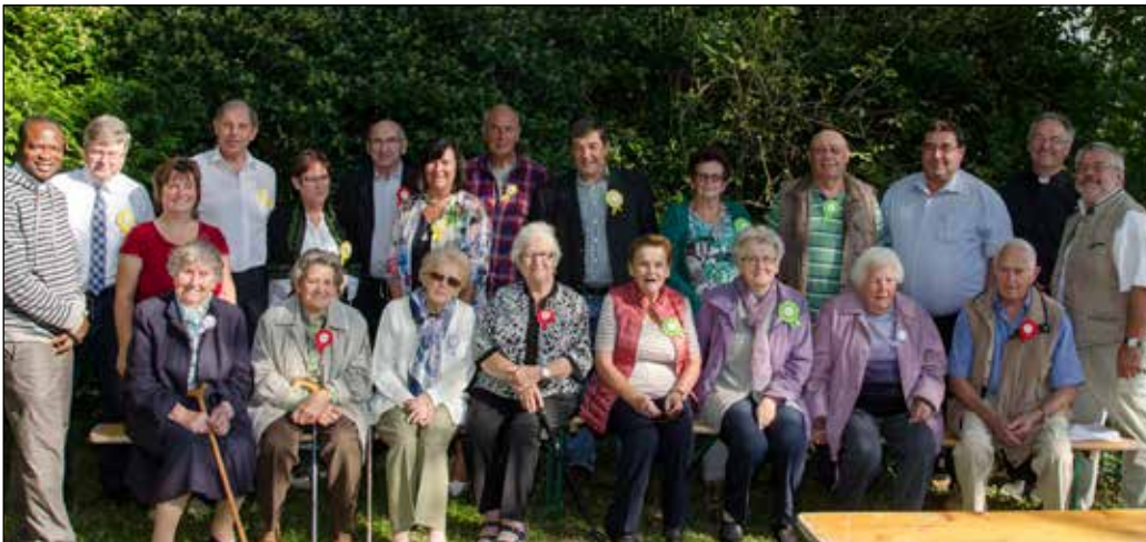
Die Runden Geburtstage feierte am Sonntag, 25. September, die Pfarre beim Pfarrfest in Haunoldstein. (Namen siehe rechts).

Rosenkranz im Okt.: Sonntag, 14:30 Uhr in der Bründlkapelle