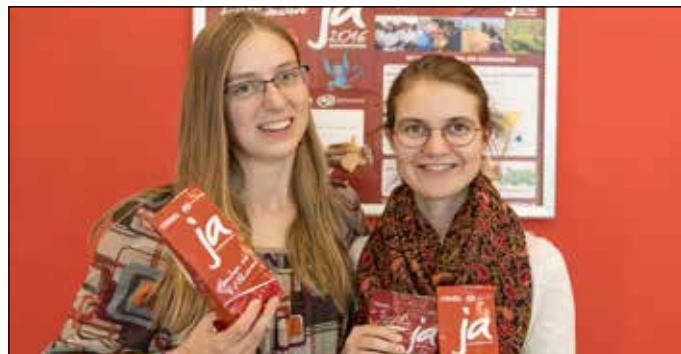
Faire Pralinen am Sonntag der Weltkirche: 23. Okt.