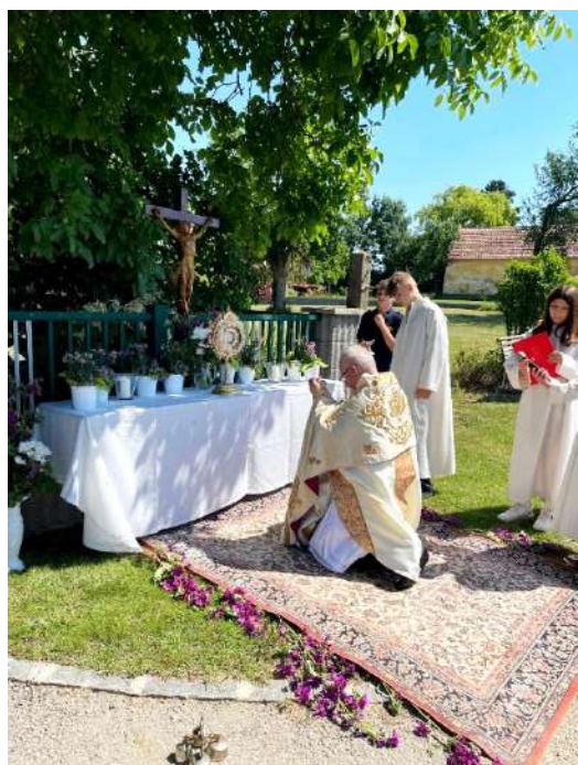
Altar in Vorstadt von Ranzelsdorf

Zur Ehre Gottes und unseres HERRN, der im Allerheiligsten Sakrament zugegen ist, wurden jeweils vier Altäre wunderschön geschmückt. Vier Mal wurde das Evangelium vorgetragen, die großen Fürbitten gebetet und der sakramentale Segen mit dem Allerheiligsten gespendet, von festlichen Gesängen des Kirchenchores begleitet.