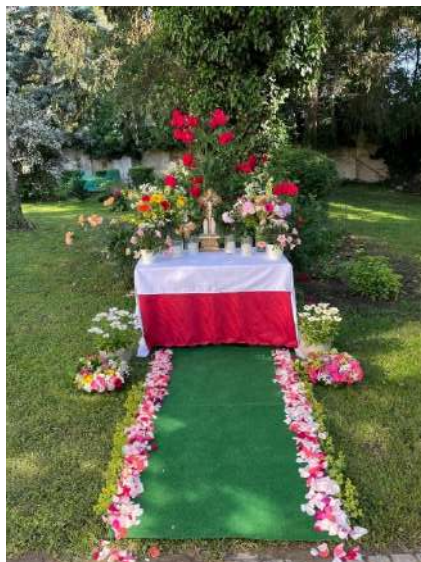
Dankbar für Gemeinschaft mit Jesus und Glaubensgemeinschaft!

Ich danke auch allen, die sich bereit erklärt haben, für den neuen Pfarrgemeinderat zu kandidieren und sich für die Gemeinde einzusetzen. Möge Gott Ihre Bemühungen unterstützen. Und möge der Heilige Geist Ihre Tätigkeit erleuchten und Initiativen vorschlagen, die den Weg für unsere Pfarre weisen werden.