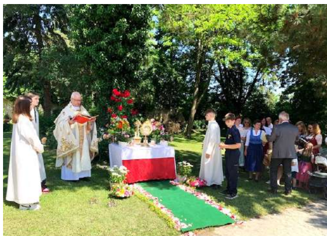
Vierter Altar im Pfarrgarten Abstetten

In Abstetten wurde die Fronleichnam-prozession bereits am Dreifaltigkeitssonntag, 12. Juni gefeiert. In Rappoltenkirchen fand sie am Fronleichnamstag, 16. Juni statt.