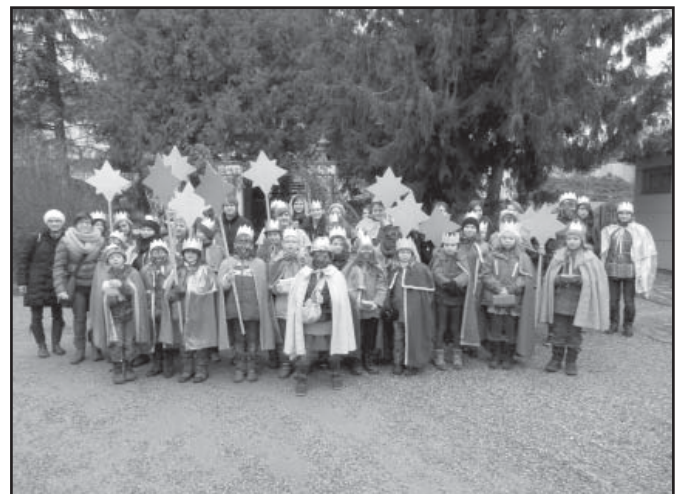
Die gesamte Garser SternsingerInnen-Truppe mit 36 Kindern und 12 BegleiterInnen.

Ebenso einen herzlichen Dank für Ihre Spende, mit denen anderen Mitmenschen geholfen werden kann!