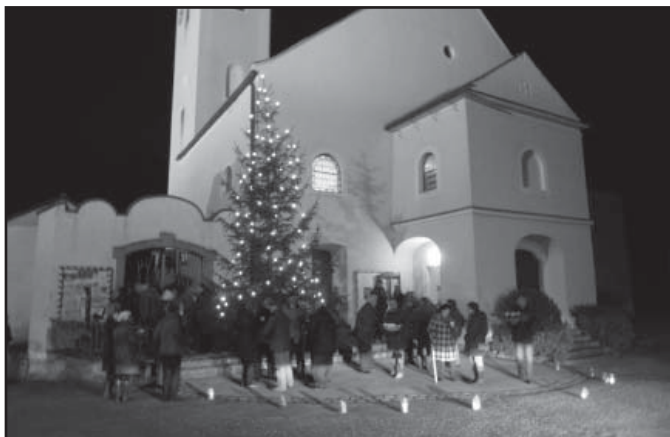
Adventstimmung vor der Pfarrkirche.