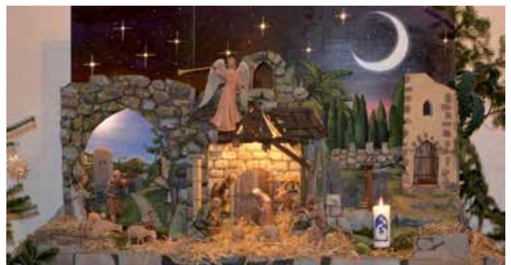
Foto Titelseite: Seit dem Vorjahr in neuem Kleid - die Weihnachtskrippe in der Zwettler Stadtpfarrkirche